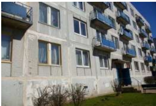
Būve ar kadastra apzīmējumu 1700 002 0367 001