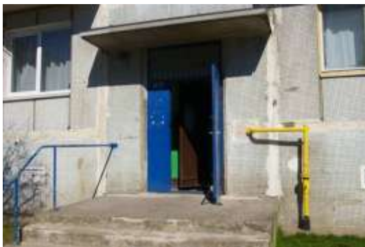
Būve ar kadastra apzīmējumu 1700 002 0367 001