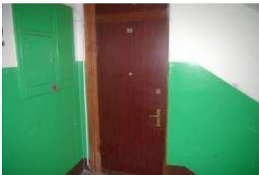
Būve ar kadastra apzīmējumu 1700 002 0367 001, dzīvoklis Nr.36